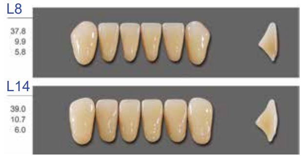
TABLA DE COMBINACIÓN